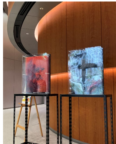
トリックアート（小藪 昭治 作）