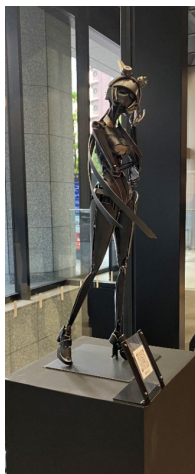
造形（正元 嶺至 作）